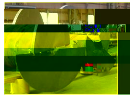
提案構造 つばさ柱を適用

既存の鉄骨構造に、つばさ柱を適用することで、構造性能を向上させ、耐久性を高めることができます。